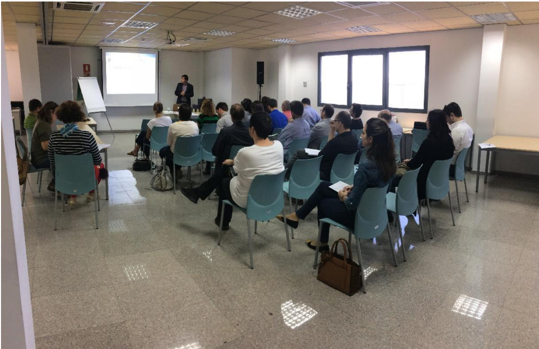
Foto 7. Imatge de la presentació dels articles de la Llei de residus al taller de Mallorca-administracions.