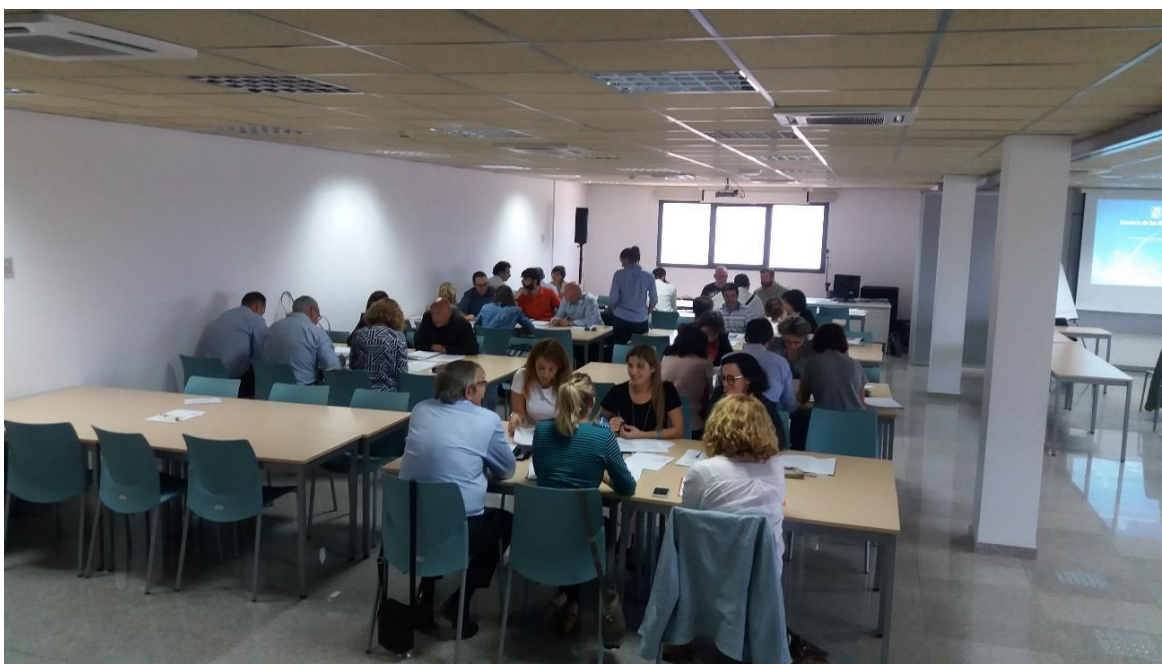
Foto 12. Imatge dels grups de treball al taller de Mallorca-empreses.