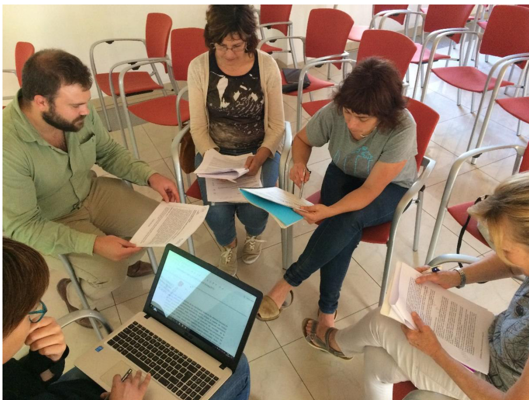
Foto 10. Imatge d'un dels grups de treball al taller de Mallorca-ciutadania.