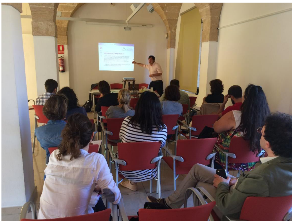
Foto 9. Imatge de la presentació dels articles de la Llei de residus al taller Mallorca-ciutadania.