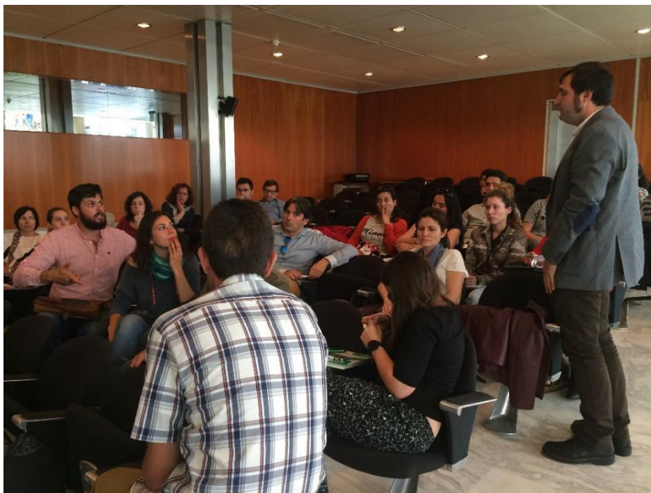
Foto 2. Imatge del taller d'Eivissa