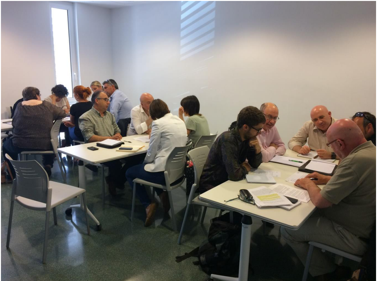
Foto 14. Imatge del taller de Menorca.