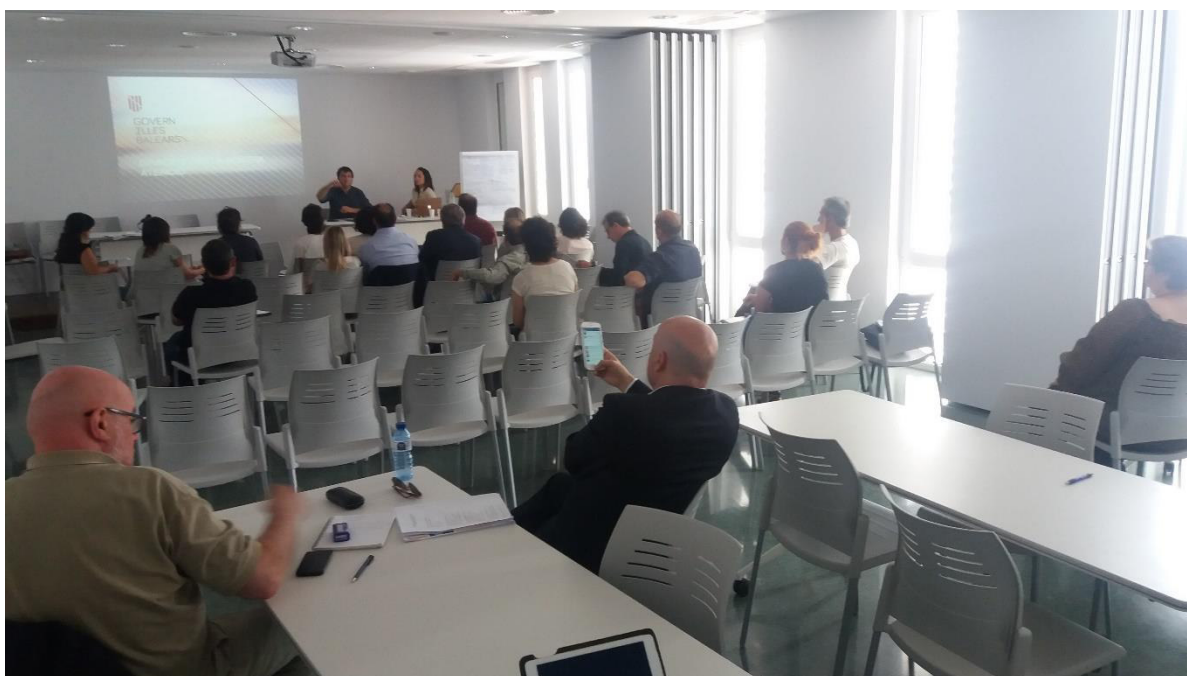
Foto 16. Imatge de la presentació dels articles de la Llei de residus al taller de Menorca.