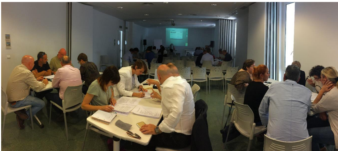
Foto 15. Imatge dels diferents grups de treball al taller de Menorca.