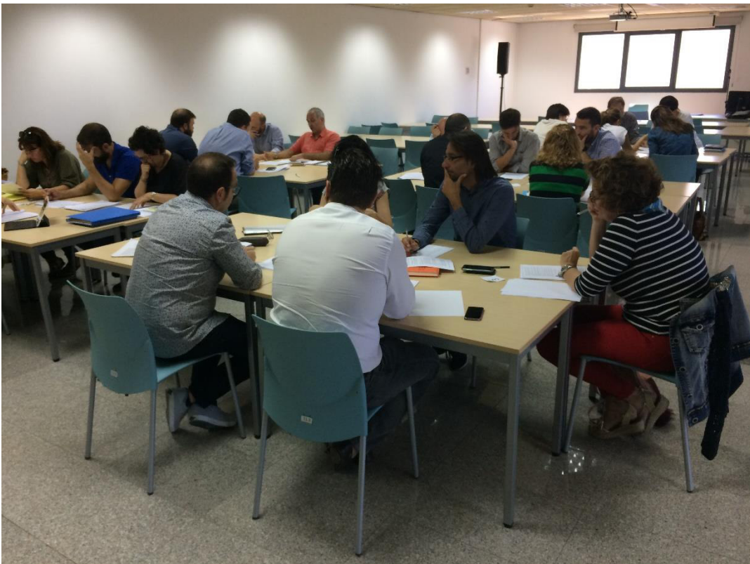
Foto 8. Imatge dels grups de treball al taller Mallorca-administracions.