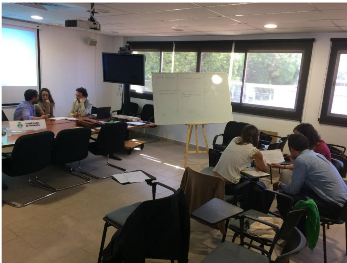
Foto 4. Imatge dels grups de treball a Fomentera.