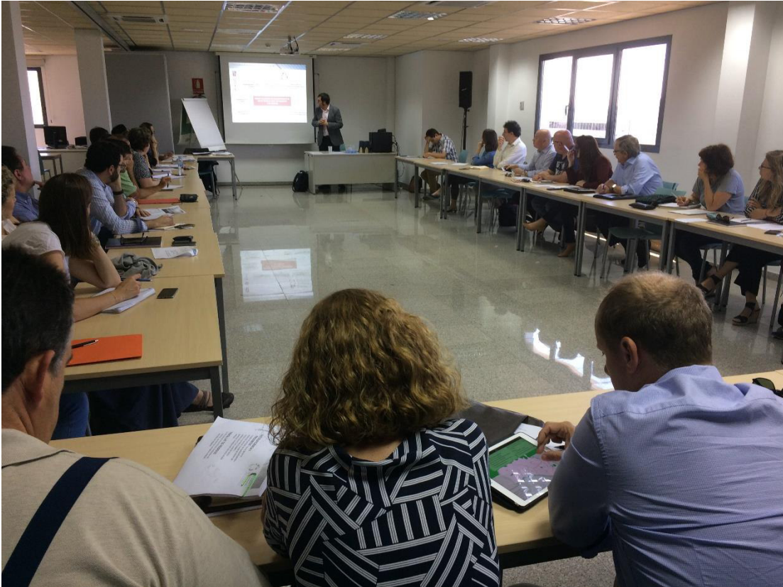
Foto 13. Presentació dels articles de la llei de residus al taller de Mallorca-empreses