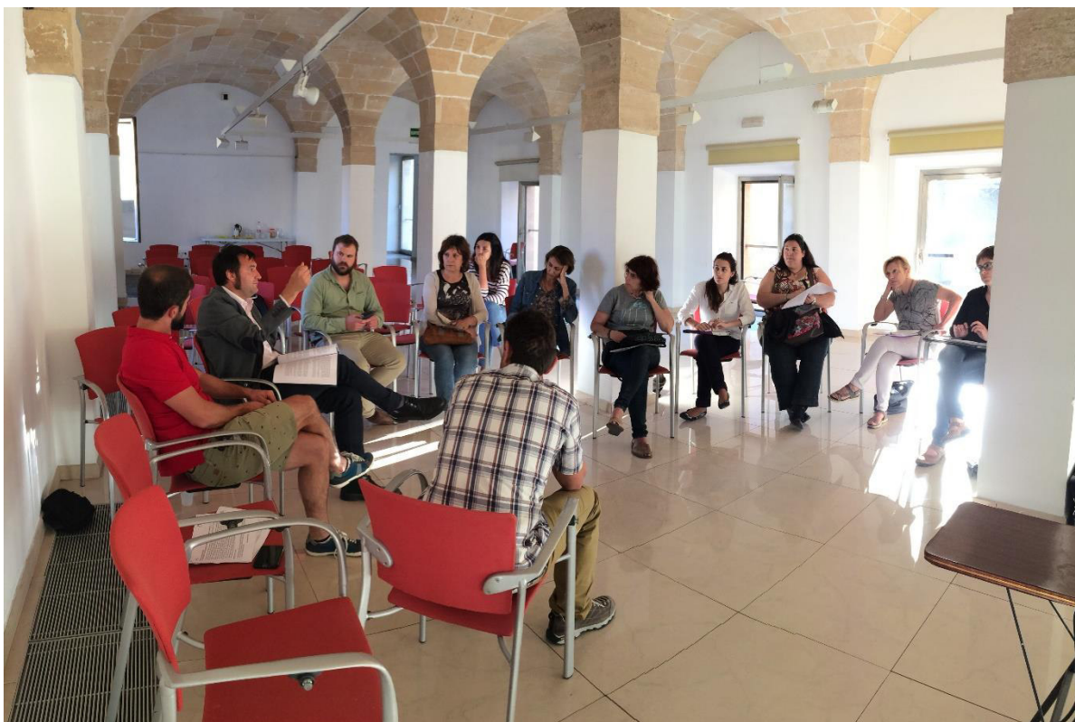
Foto 11. Imatge del taller de Mallorca-ciutadania.