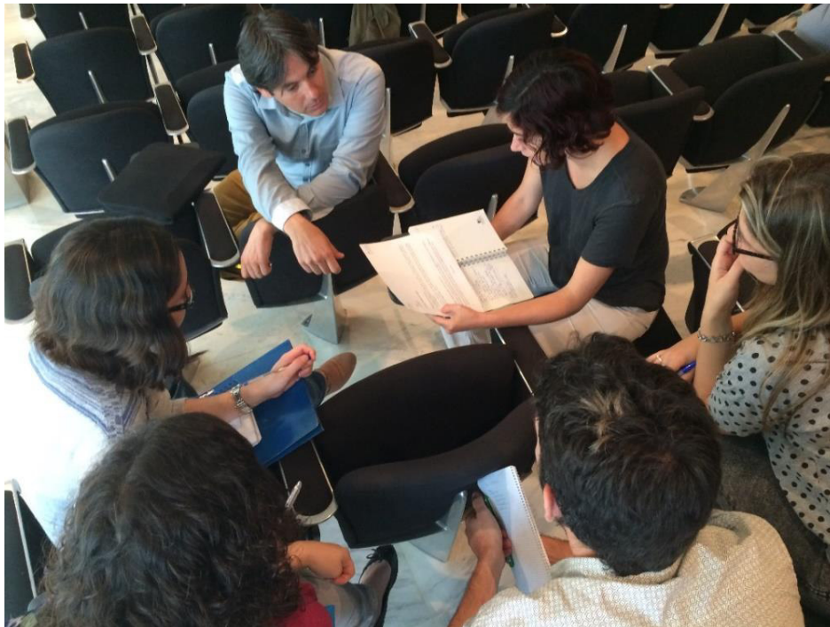
Foto 1. Imatge d'un dels grups de treball al taller d'Eivissa.