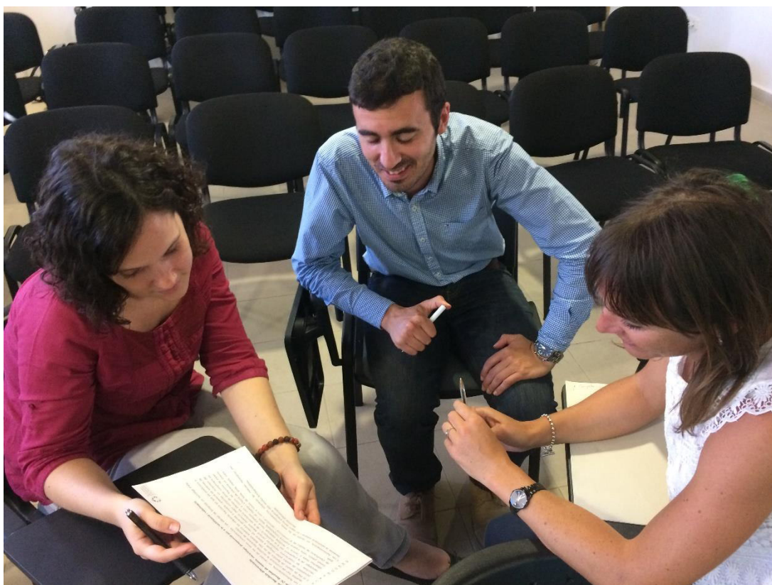
Foto 6. Imatge d'un dels grups de treball al taller de Formentera.