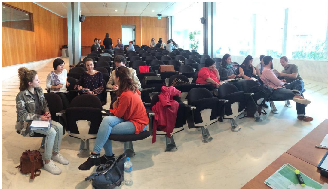
Foto 3. Imatge dels diferents grups de treball al taller d'Eivissa.